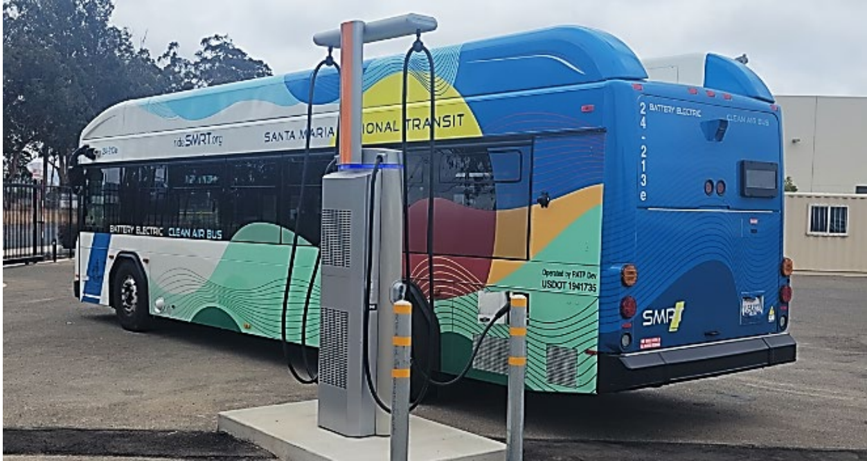
Autobús eléctrico SMRT