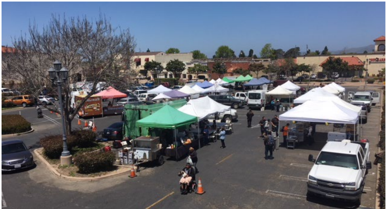
Mercado de agricultores en el centro de Santa María

La tasa de inseguridad alimentaria entre los adultos en Santa María (16 por ciento) es el doble que en el condado de Santa Bárbara (8 por ciento). La inseguridad alimentaria puede provocar desnutrición, fatiga, retraso en el desarrollo y problemas de salud relacionados. El acceso a la comida es más limitado en las zonas noreste y noroeste de la ciudad, además de una gran zona al suroeste del centro. En algunas de estas zonas, el 33 por ciento de la población vive a más de una milla de un supermercado, supercentro o gran supermercado. Durante las actividades de participación, los miembros de la comunidad identificaron la necesidad de un acceso más equitativo a alimentos nutritivos (por ejemplo, huertos, tiendas de barrio que vendan alimentos más saludables), una mayor variedad de opciones de alimentos saludables y alimentos más asequibles.