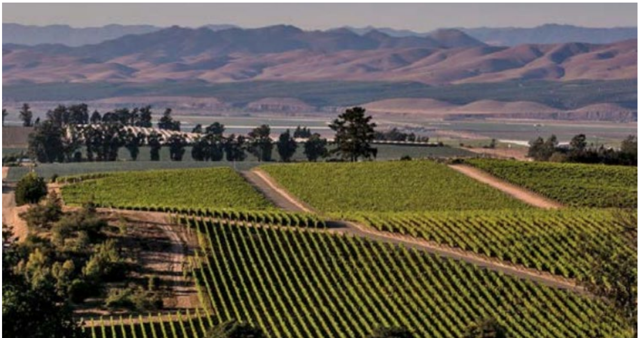
Campos agrícolas en Santa María.

En comparación con otras comunidades de California, Santa María experimenta tasas más altas de exposición a pesticidas, ya que la mayoría de los sectores censales de la ciudad están por encima del percentil 80 en el uso de pesticidas. El uso de pesticidas durante la producción agrícola supone riesgos significativos para la salud pública, ya que tanto la exposición a corto como a largo plazo están vinculadas a enfermedades graves como cánceres, complicaciones del embarazo y problemas de desarrollo, especialmente en niños, mujeres embarazadas, adultos mayores y trabajadores agrícolas. Los DAC situados cerca de campos agrícolas, incluidas comunidades de trabajadores agrícolas en Santa María y sus alrededores, enfrentan riesgos de exposición elevados.