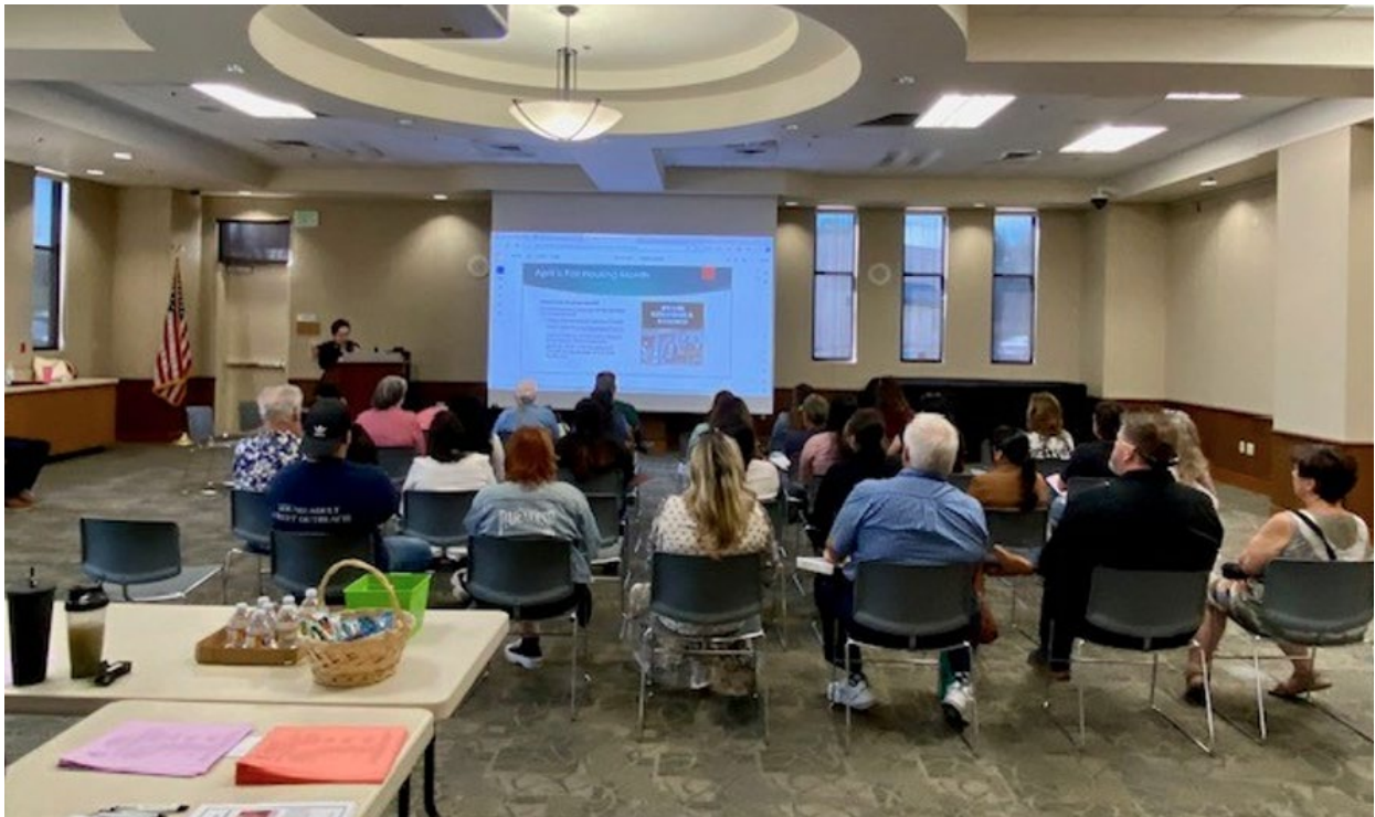
Reunión pública celebrada en Shepard Hall, en la Biblioteca de Santa María.

Compromiso cívico. Ampliar prácticas de participación inclusivas y equitativas y crear oportunidades de desarrollo de liderazgo para miembros diversos de la comunidad puede aumentar la implicación en la toma de decisiones y procesos de la ciudad, especialmente para quienes normalmente no están implicados.