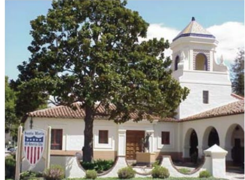
Ayuntamiento de Santa María