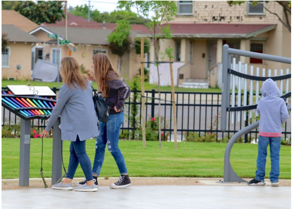
Arriba e abajo: El acceso a parques y otros espacios verdes, como Machado Plaza en el centro de Santa María en Chapel Street, es esencial para la salud comunitaria.