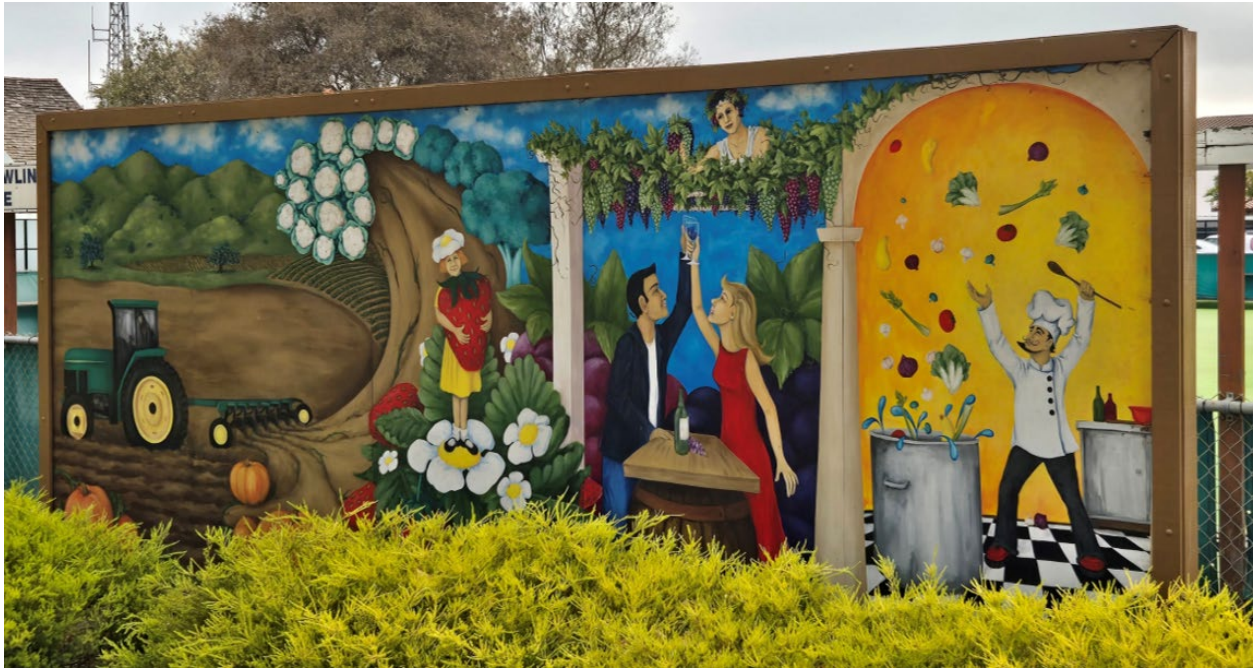
Mural pintado situado en South McClelland Street en Santa María.