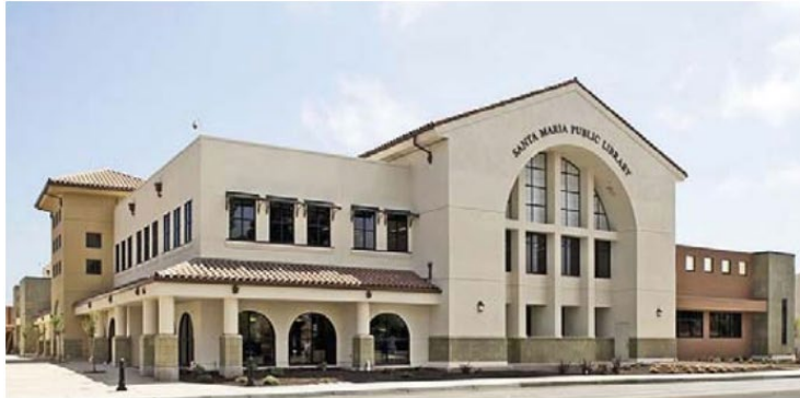
Biblioteca Pública de Santa María

Durante el proceso de participación, muchos miembros de la comunidad compartieron que se enfrentaron a barreras que limitan su capacidad para participar en actividades y toma de decisiones de la ciudad, como la falta de concienciación, los horarios inoportunos de las reuniones y el acceso al idioma. Estas barreras suelen afectar a residentes de bajos ingresos, jóvenes, personas con discapacidad y quienes tienen un dominio limitado del inglés. Específicamente, los miembros jóvenes compartían interés en participar en el proceso cívico, pero algunos carecían del conocimiento o la conciencia de cómo y cuándo podían participar.