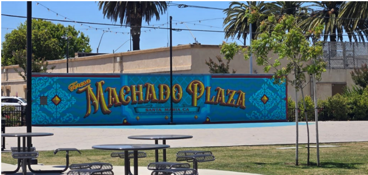
Mural pintado en la Plaza Machado, en el centro de Santa María.

Top izquierda: Músicos tocando en un evento comunitario; Arriba a la derecha: miembros de la comunidad pintando una caja de servicios; Abajo a la izquierda: Arte Público en cajas de servicios; Imagen inferior derecha: Artistas en un evento cultural local.