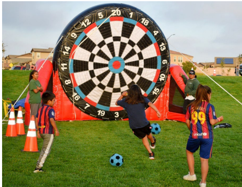
Bottom: Los niños juegan con una portería inflable de fútbol en un evento comunitario organizado por el Departamento de Recreación y Parques.