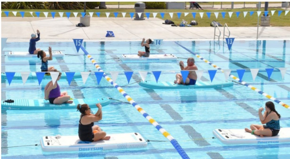
Clase de yoga con paddleboard en el Paul Nelson Aquatics Center.

La ciudad también complementa sus instalaciones mediante el uso conjunto de gimnasios y campos escolares y servicios privados como la YMCA y el Boys and Girls Club. Servicios recreativos privados adicionales que la Ciudad no posee o mantiene benefician a los residentes que tienen acceso a estos servicios.