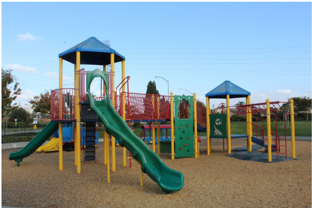
Parque infantil en North Preisker Ranch Park.