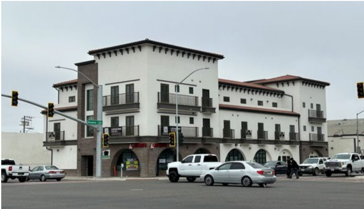
Proyecto de Uso Mixto Gateway situado en la esquina noroeste de Main Street y Broadway. Este edificio fue construido en 2024 y es un ejemplo de los recientes esfuerzos de revitalización en el centro de la ciudad.

Colaboración regional. La ciudad participa en varios esfuerzos económicos colaborativos que ofrecen importantes oportunidades para apoyar el desarrollo empresarial, la alineación de la fuerza laboral y la competitividad regional. La coordinación continua con la Base Espacial de Vandenberg, el Distrito del Aeropuerto de Santa María y las instituciones educativas puede impulsar el crecimiento de los sectores objetivo.