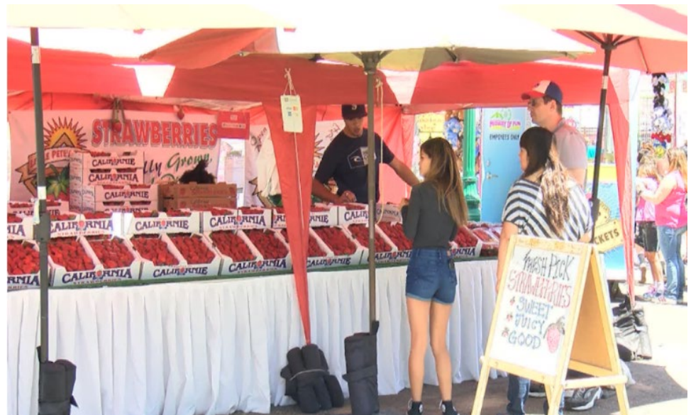
Festival de la Fresa de Santa María.