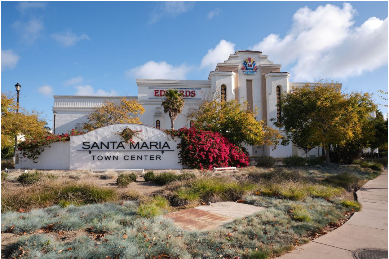
Santa Maria Town Center en el centro de Santa María.