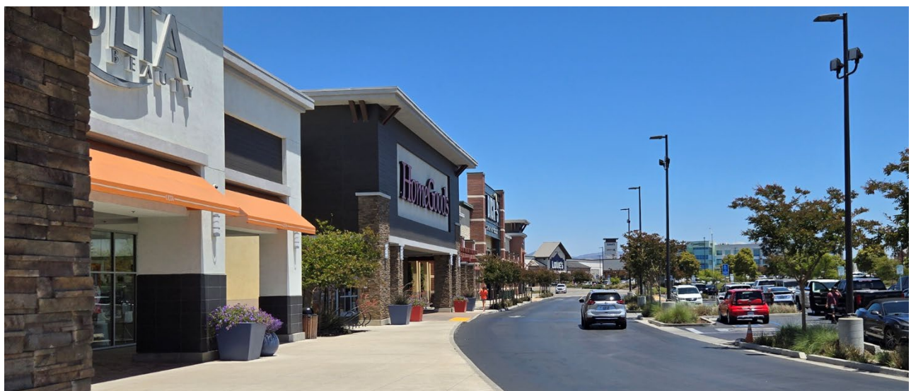
Centro Comercial Enos Ranchos en Betteravia Road.

El Elemento de Desarrollo Económico proporciona un marco para fomentar una economía diversa y resiliente en Santa María. Apoya empleos de alta calidad, oportunidades educativas y de desarrollo laboral, y un entorno favorable para los negocios que fomenta la innovación y la inversión. El Elemento enfatiza la revitalización de los corredores comerciales y del centro de la ciudad, el apoyo a industrias clave y la mejora de la diversidad de infraestructuras y viviendas para satisfacer las necesidades de una comunidad en crecimiento. A través de la colaboración regional, el apoyo específico de la industria y la expansión del sector turístico, Santa María puede fortalecer las oportunidades económicas, fortalecer su identidad y promover la prosperidad a largo plazo para residentes y empresas.