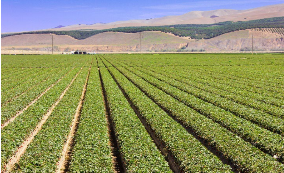
Campos agrícolas en el Valle de Santa María.