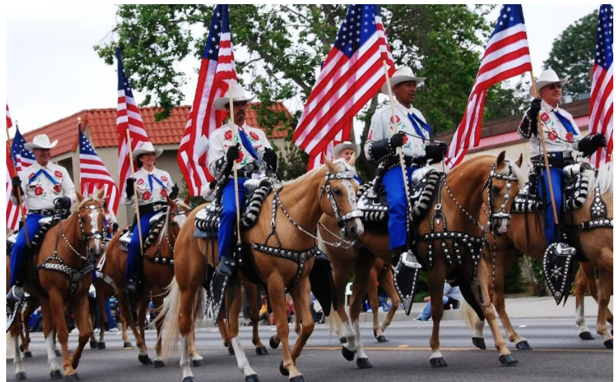
Desfile de Rodeo de los Santa Maria Elks.